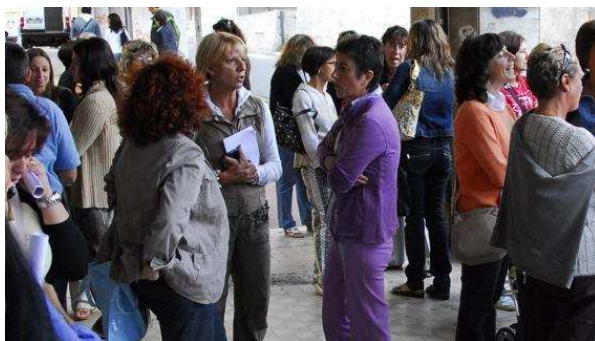
Protesta in Provveditorato dei concorrenti per i posti da presidi

agli scritti, prima bocciati, ora ammessi per la prima volta all'orale, l'altra è quella dei 96 semi-trombati, che possono contare su una prova orale superata con un successo e uno scritto giudicato in due modi opposti: sufficiente per la prima commissione, insufficiente per la seconda.